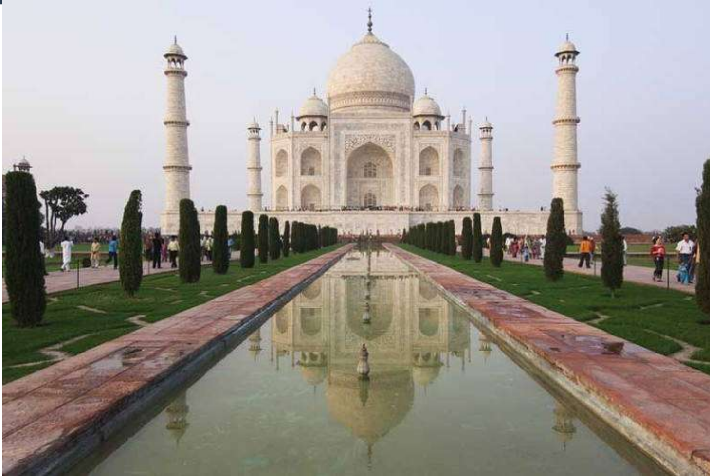
Le Taj Mahal (mausolée), Agra (Inde), 1631-1648 Commanditaire : Shah Jahan