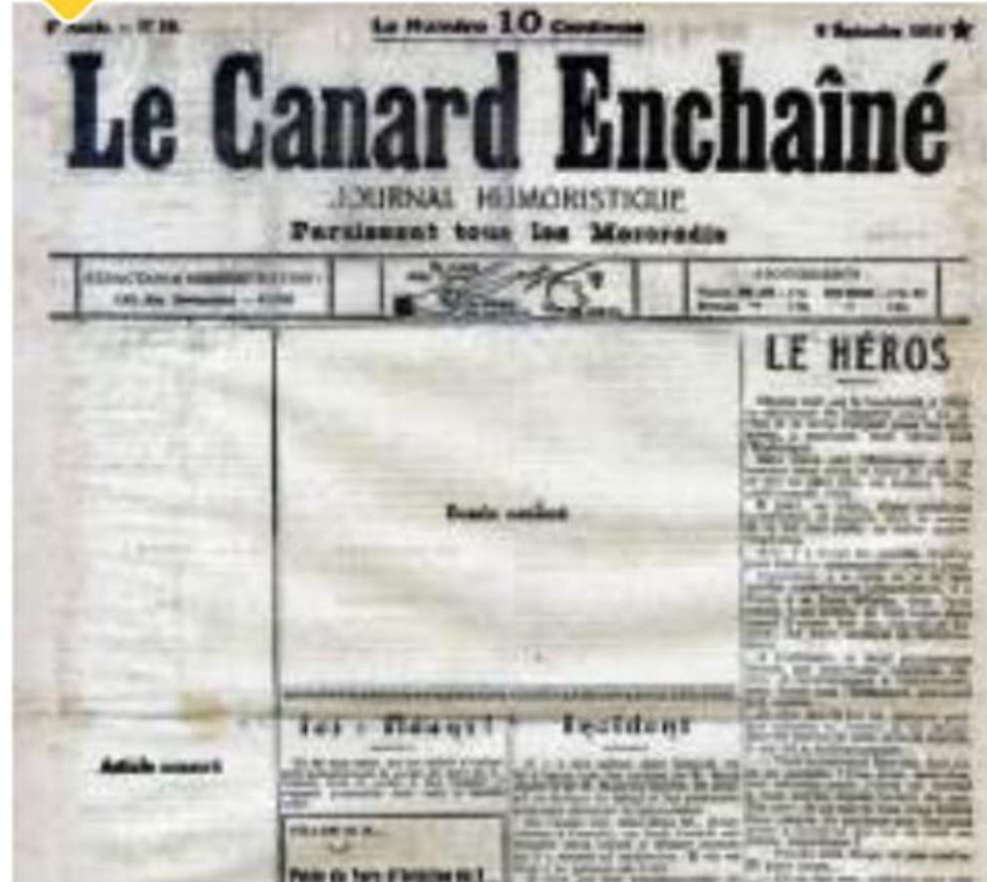
▲ Une du journal Le Canard Enchaîné , septembre 1916.