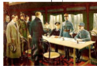
Armistice de Rethondes. 11/11/1918