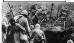
Soldats français à Verdun.

Bataille de Verdun 21/02/1916 à 18/12/1916