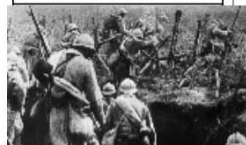
Soldats français à Verdun.

Bataille du chemin des Dames (offensive Nivelle).