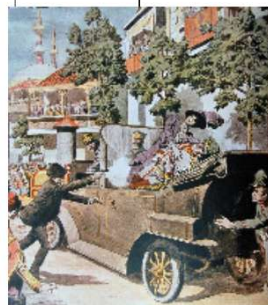
Assassinat de François-Ferdinand, héritier du trône d'Autriche, à Sarajevo (Bosnie).