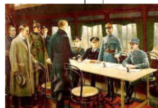
Armistice de Rethondes.