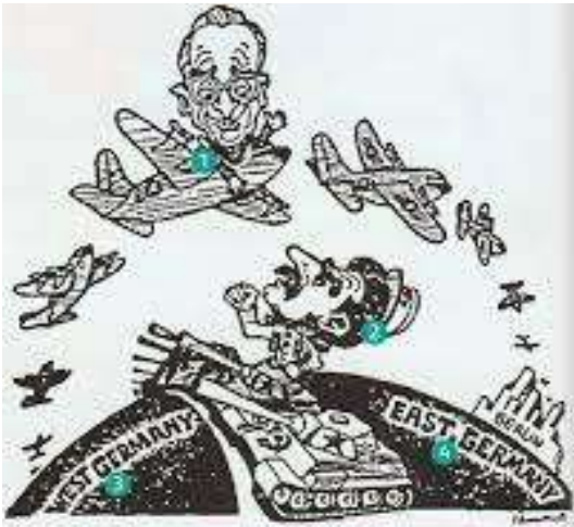
Le blocus de Berlin (juillet 1948-juin 1949)

En juin 1948, Staline coupe les accès terrestres des zones américaine, anglaise et française vers l'Allemagne de l'Est. Un pont aérien est mis en place par le président américain Truman depuis l'Allemagne de l'Ouest. Caricature de 1949, OTAN.