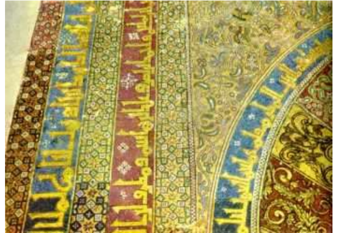
Document 2 : Grande mosquée de Cordoue : la mosaïque du mihrab, exécutée par des artisans que le calife omeyyade El-Hakan fit venir de Byzance

4) Dans le document 2, quel élément appartient à la civilisation byzantine ?