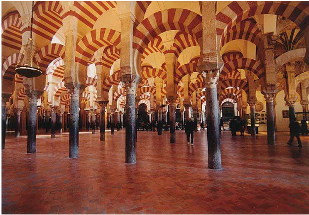
Document 1 : la salle de prières de la grande mosquée de Cordoue.