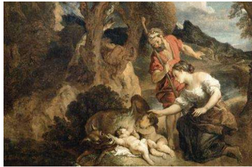
Rémus et Romulus, Charles de la Fosse, 1700.