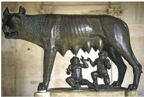
Le Louve du Capitole (anonyme, XIII e -XV e s)

→ Où et quand la ville a-t-elle été fondée ?